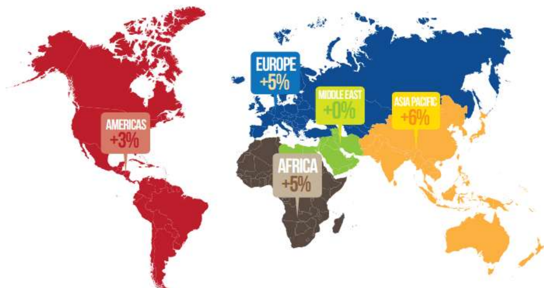
Gambar A. Kunjungan Wisman Dunia Tahun 2013