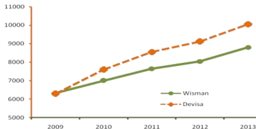
Grafik A. Perkembangan Jumlah Kunjungan Wisman Ke Indonesia dan Devisa Tahun 2009 - 2013

Data yang telah dihimpun mencatat jumlah wisatawan mancanegara (wisman) yang berkunjung ke Indonesia meningkat sebesar 9,42% yakni sebanyak 8.802.129 kunjungan dibanding tahun 2012 sebanyak 8.044.462 kunjungan, sedangkan devisa yang diperoleh sebesar 10,05 miliar USD atau mengalami peningkatan sebesar 10,23% dibanding tahun 2012 yang hanya 9,12 miliar USD.